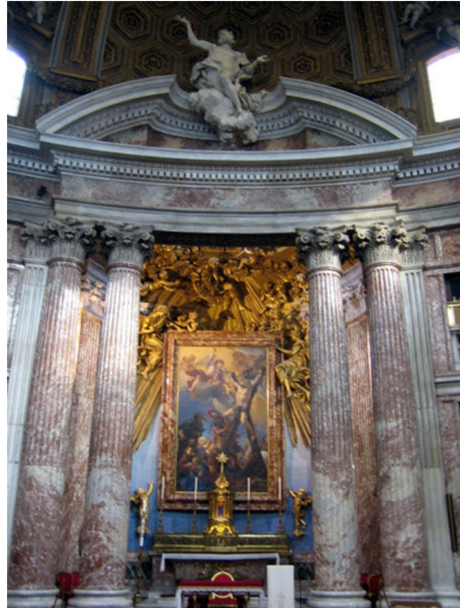
Bernini, altar de San Andrea del Quirinal