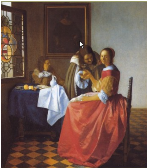
Vermeer, La jove del vas

Al segle XVIII començaren a regnar a Espanya els Borbó produint grans canvis polítics i l'apropament amb França. També és el segle de la Il·lustració , que posa les bases dels moviments revolucionaris posteriors.