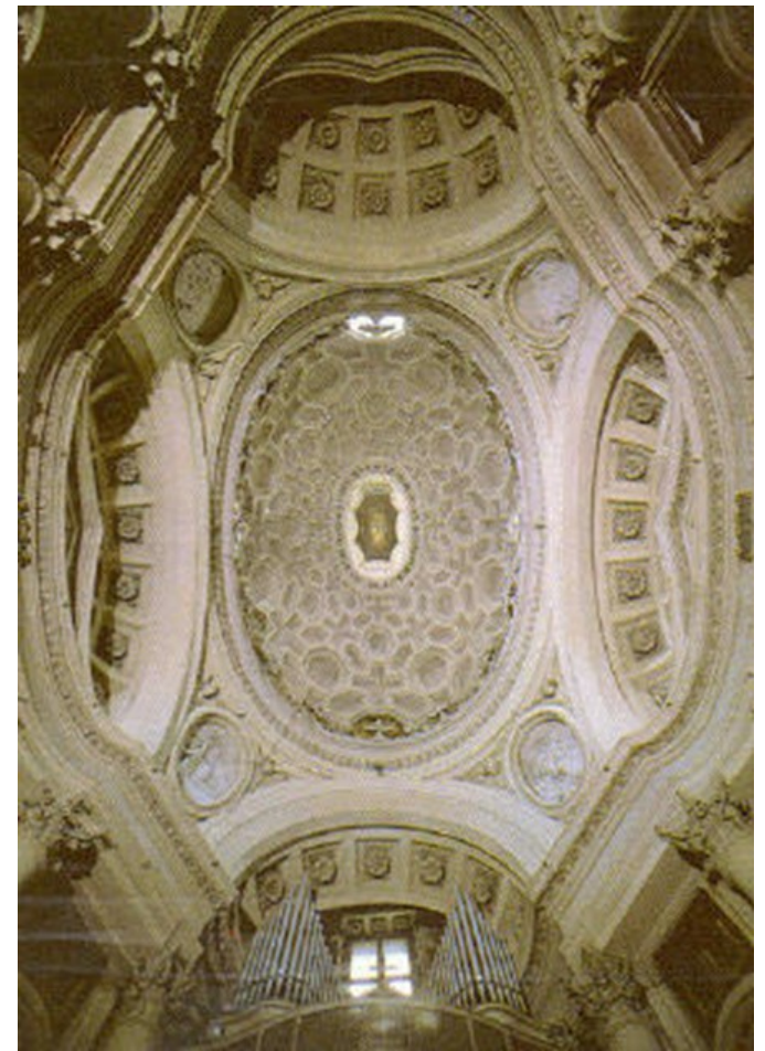
Borromini, cúpula ovalada de Sant Carlo alle Quattro Fontane