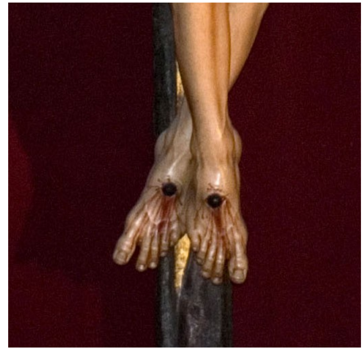
Juan Martínez Montañés, El Cristo de la Clemencia o de los Cálizes , escultor de l'escola sevillana.