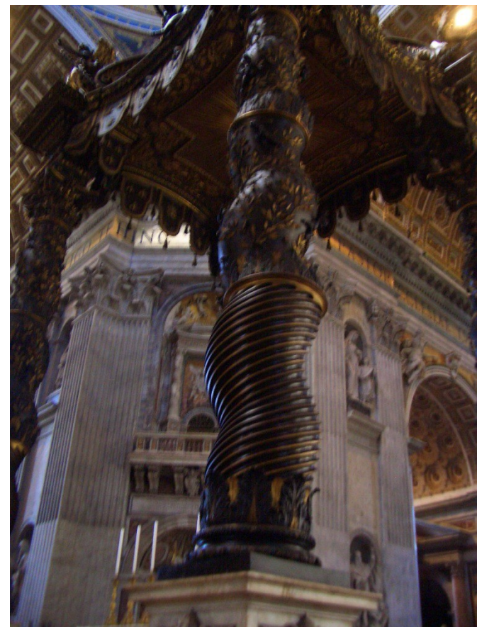
Baldaqú de San Pere, de Bernini, sostingut per 4 columnes salomòniques