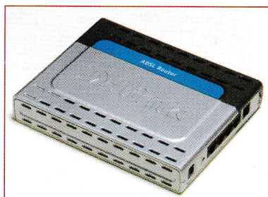
Un encaminador o router.

5. Explica les diferències entre un concentrador i un encaminador.