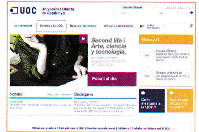
Pàgina web de la Universitat Oberta de Catalunya.

Portals com Laboris.net i InfoJobs.net, entre altres, recullen les ofertes de feina de les empreses per trobar amb facilitat persones que reuneixin les condicions per ocupar cada lloc de treball.