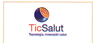
Logotip de TicSalut.