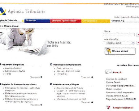
Web de l'oficina virtual de l'Agència Tributària.

Empreses com Telefònica, Endesa o Gas Natural, entre altres, ja ofereixen el servei d'enviar les factures per correu electrònic, i així s'estalvien paper i, alhora, protegeixen la natura.